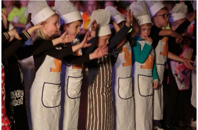
De vorige sluiting in de sporthal was te volgen via een livestream. Nu bent u weer welkom!

De ingang in het midden blijft gesloten. U kunt via de kleedkamergangen de zaal betreden en aan de zijkanten plaats nemen. Bij deze vragen wij uw medewerking, zodat zoveel mogelijk kinderen en ouders kunnen genieten van dit spektakel.