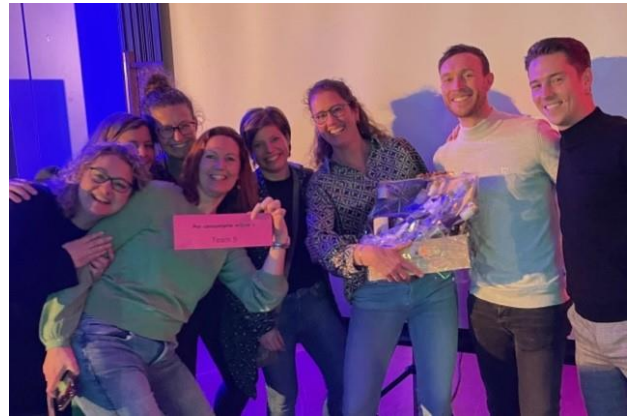
Het winnende team van de Antonius Pubquiz