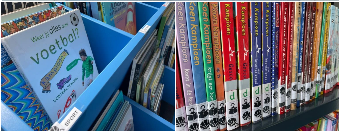
Informatieve boeken, boeken voor makkelijk lezen en boeken voor kinderen met dyslexie: Het is er allemaal!