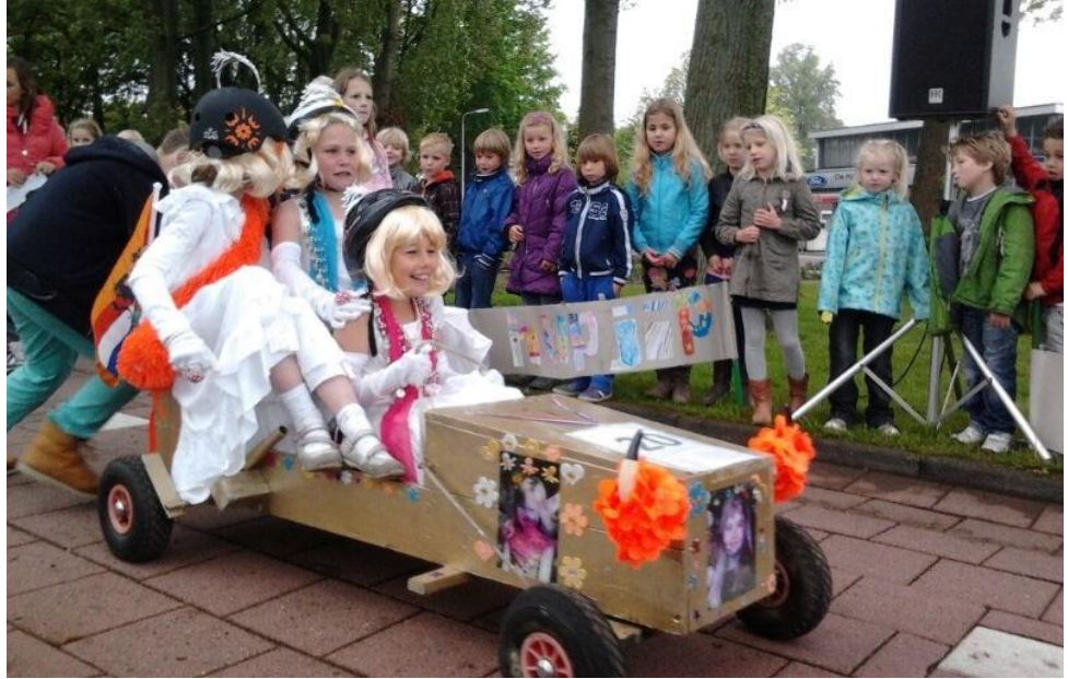
Een archieffoto uit 2013. De kinderen in het publiek zitten nu in groep 8!

Op de jaarkalender stond het al aangekondigd, 10 april organiseren wij voor de derde maal een Antoniuschool Zeepkistenrace. Vorige keer gingen er in 2013 maar liefst 25 karren de Madame Curiestraat af. Het was een gigantisch spektakel. Kinderen maken zelf een kar en gaan dan zo mooi, zo snel of zo origineel mogelijk naar beneden. We verheugen ons nu al weer op de creativiteit en het plezier van de kinderen. Ga dus snel aan de slag om een eigen zeepkist te maken.